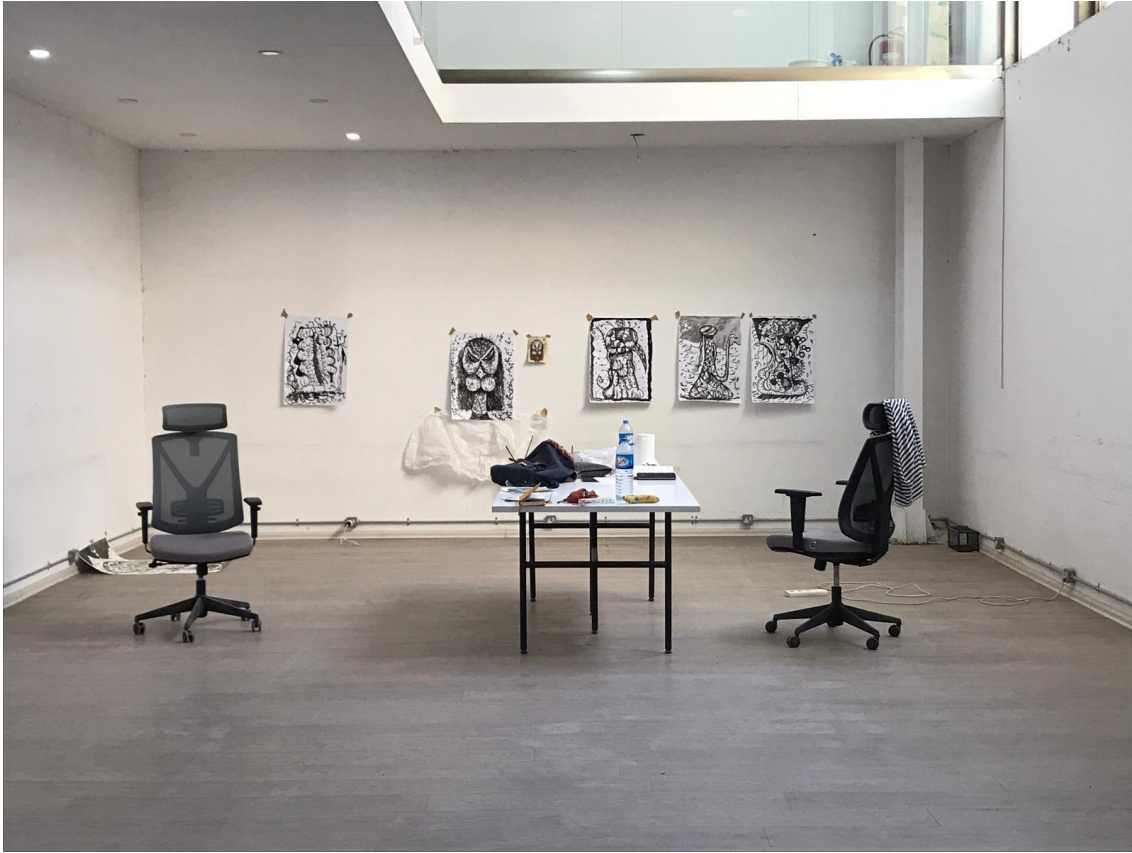
Egoitzako estudioaren argazkia.