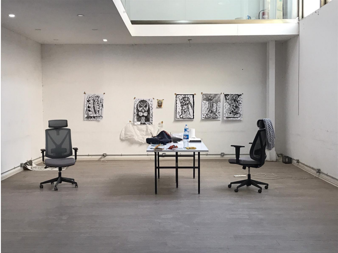
Imagen del estudio durante la residencia.